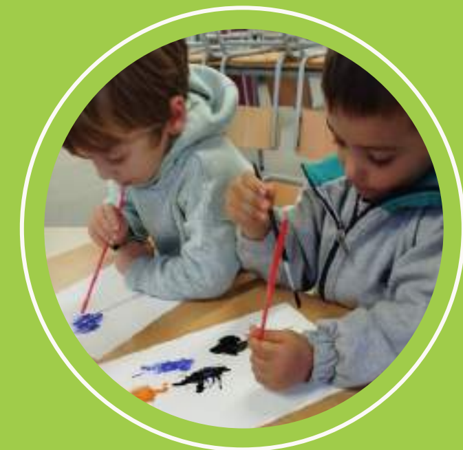
experimentació amb pintura