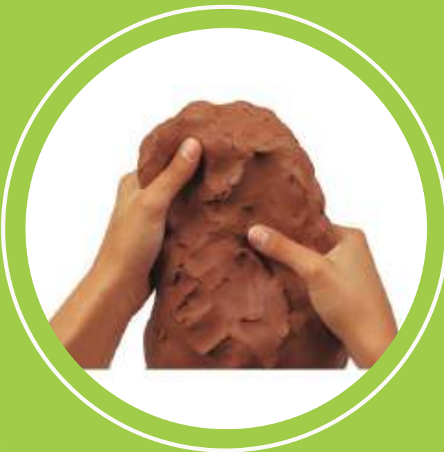
experimentació amb fang