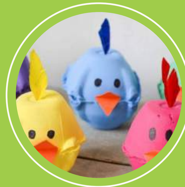
treball amb material reciclat