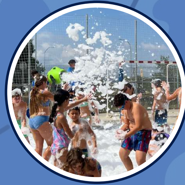
festa de l'escuma