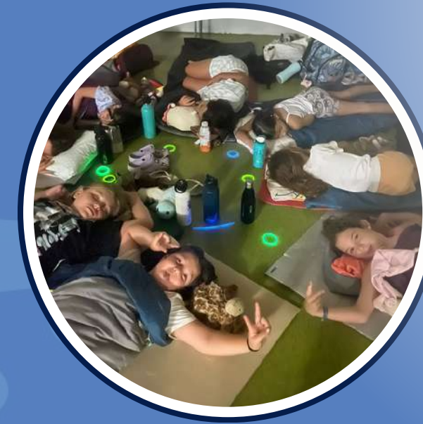
Nit al casal