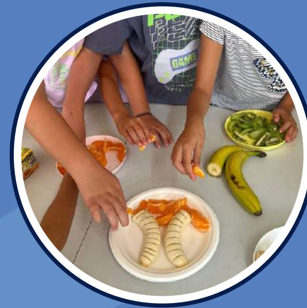
activitats i tallers