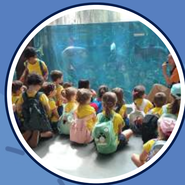
excursió al Cosmocaixa