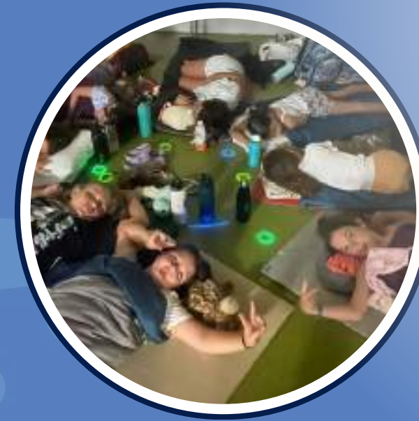
Nit al casal