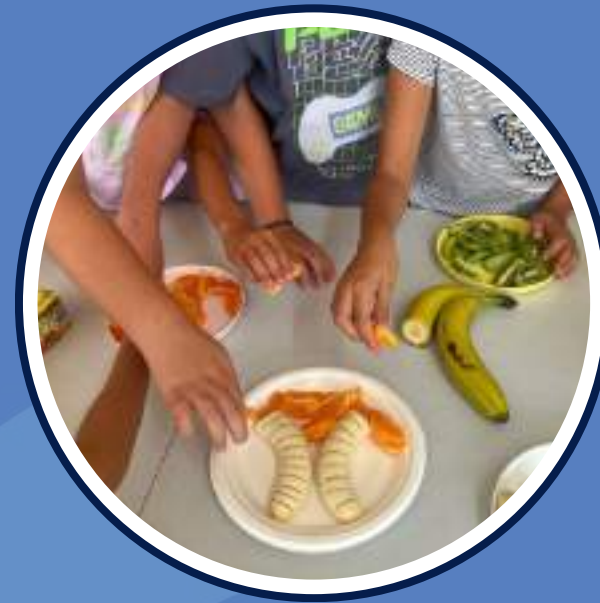
activitats i tallers