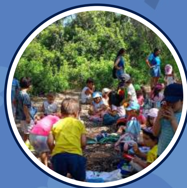
sortides per l'entorn