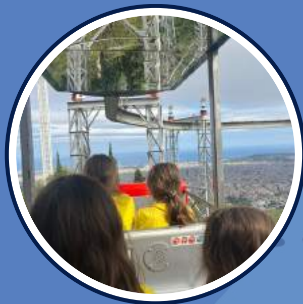
excursió al Tibidabo