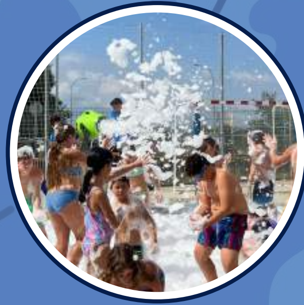
festa de l'escuma